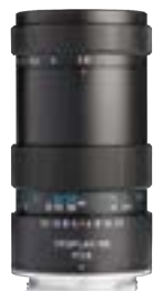
Trioplan 100mm F2.8 II