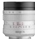
Biotar 75mm F1.5 II