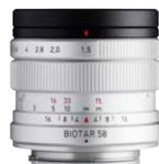
Biotar 58mm F1.5 II