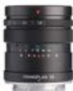
Primoplan 58mm F1.9 II