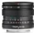
Trioplan 50mm F2.8 II