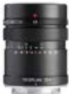
Trioplan 35mm F2.8 II