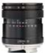
Lydith 30mm F3.5 II