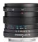
Primoplan 75mm F1.9 II